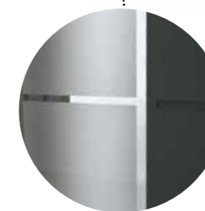
Pískovaná plocha s čírymi pruhy a okrajem